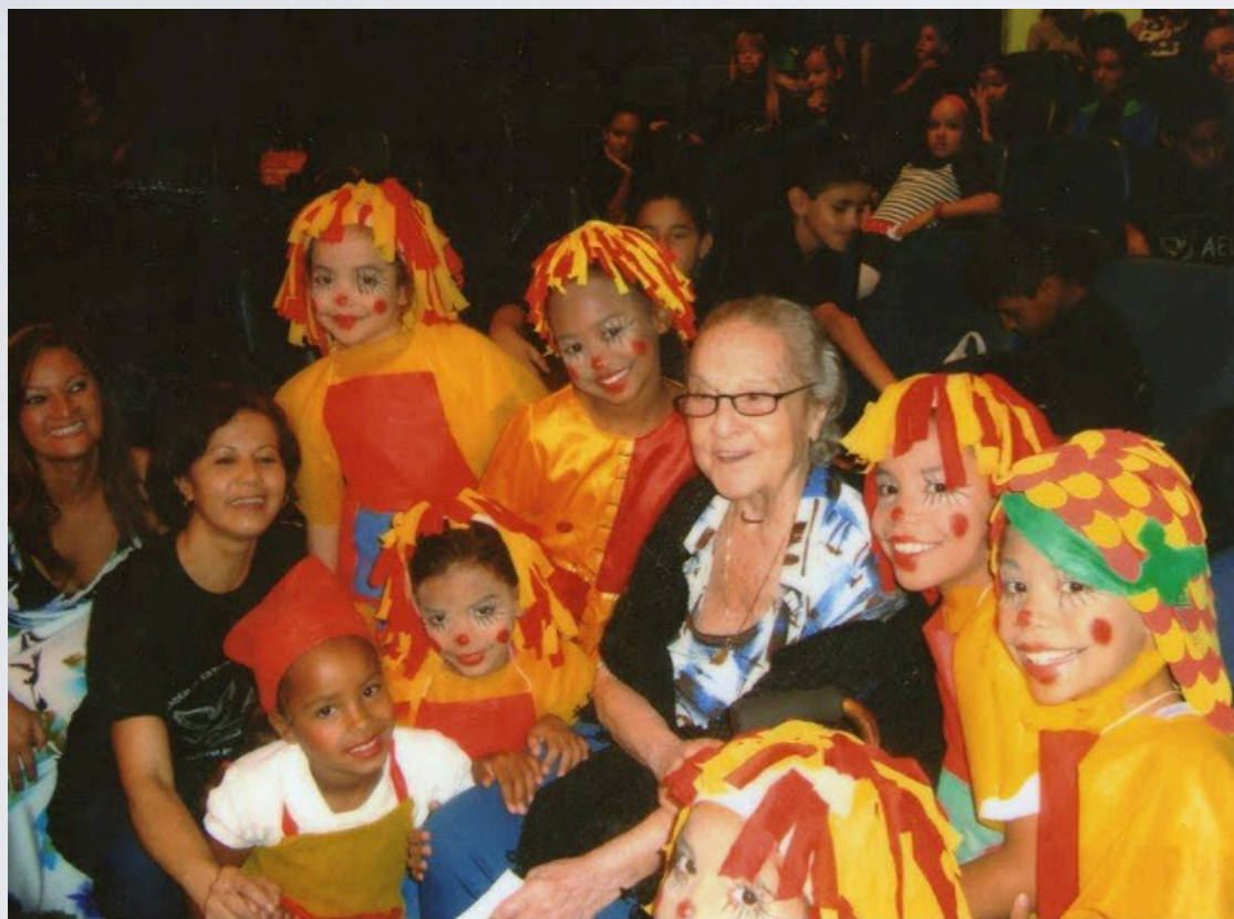
Tatiana Belinky na cerimônia de fundação e posse da Academia Estudantil de Letras que a homenageia

EVENTUALMENTE - ENCONTRO COM TATIANA BELINKY - EMEF PROFESSOR WANNY SALGADO ROCHA