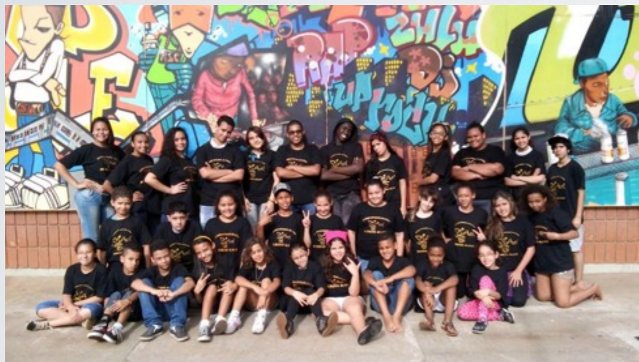
Academia Estudantil de Letras Rubem Alves EMEF Professor Maestro Alex Martins Costa