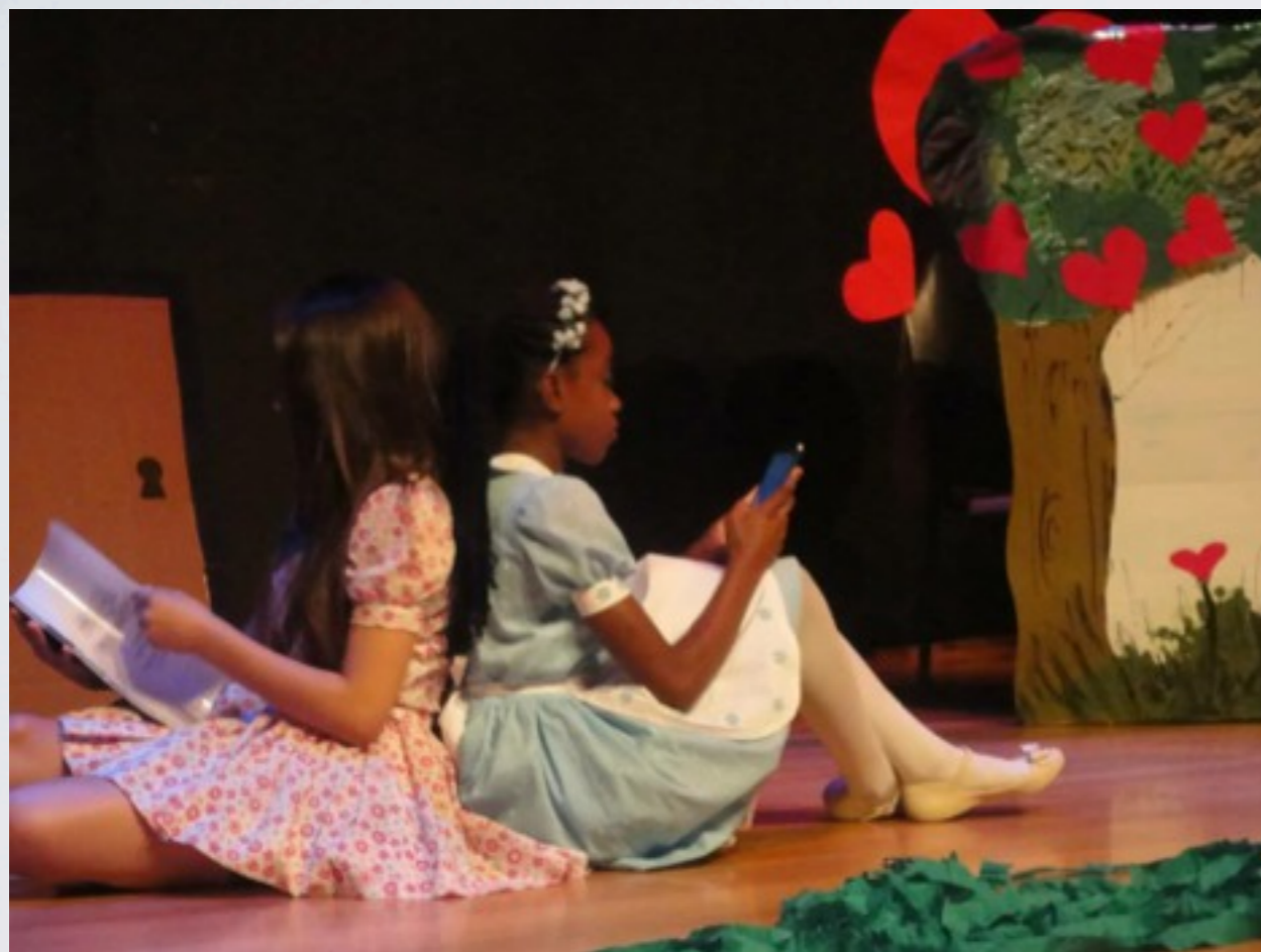
Espectáculo teatral Alice no País das Maravilhas EMEF Major Silvio Fleming